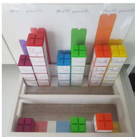
Les absents bien rangés dans les bonnes colonnes à l'aide de la fiche collée dans le fond du plateau.

Au lieu de placer une étiquette, les élèves placent un légo à leur nom en arrivant en classe. Ils empilent les légos avec plus ou moins de contraintes (filles/ garçons ou cantine / pas cantine...) L'idéal est d'avoir la photo de la tour complète contre le mur, ainsi on peut travailler sur le nombre d'absent mais aussi sur les premières situations de calculs avec les nombres.