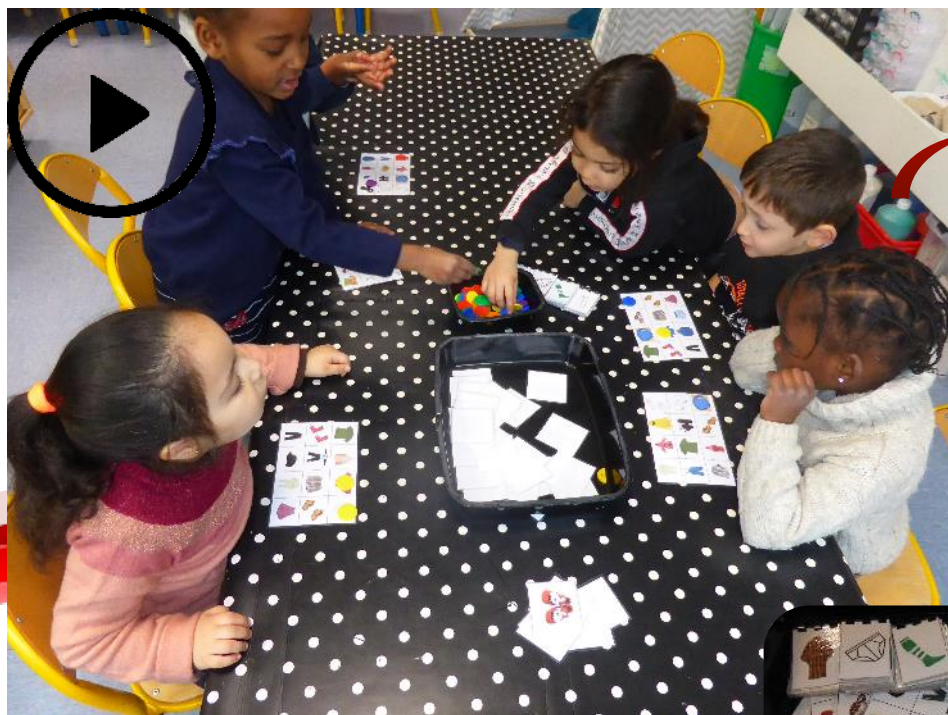
Loto des vêtements